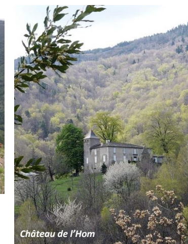
Château de l'Hom