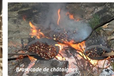
Brasucade de châtaignes