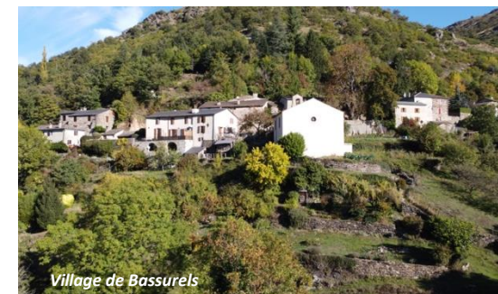
Village de Bassurels