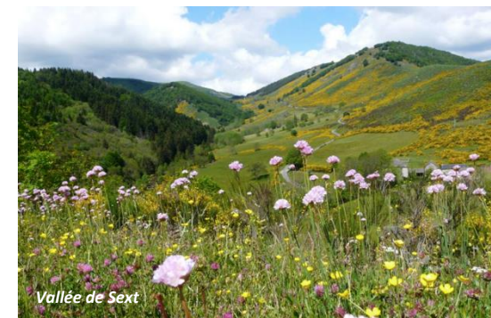
Vallée de Sext

Suivant cette définition le Patrimoine est susceptible de couvrir de nombreux domaines. Nous en avons sélectionné trois dont le caractère général et enveloppe permet de couvrir l'ensemble des préoccupations et actions à mener sur le secteur de Bassurels et du Haut-Valborgne qui dispose d'un patrimoine naturel et historique particulièrement riche.