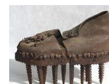
Sole à décortiquer les châtaignes