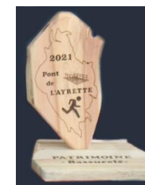
Trophée Ronde du Pont de l'Ayrette