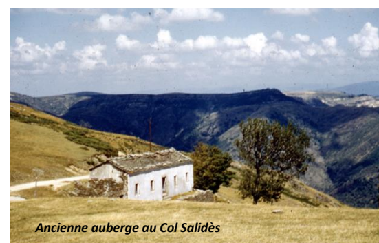
Ancienne auberge au Col Salidès