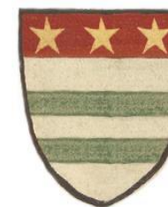
Blason de FOLHAQUIER « D'argent à deux fasces de sinople au chef de gueules chargé de trois étoiles d'or »