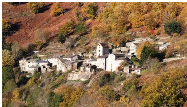
Rousses - Les Ablatats